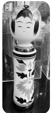
Кукла кокеши или кокэси. Это японская кукла.