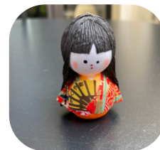
Окиагари – аналог Невалышки. Символ стойкости и талисман удачи.

1. деревянная кукла 2. русская матрёшка 3. украшение дома 4. игрушка с секретом 5. современные девочки 6. мужчина с большой головой 7. много маленьких фигурок 8. женское имя 9. похожа на крестьянку 10. с улыбкой на лице 11. чёрный петух 12. золотая медаль 13. на выставке в Париже 14. хороший художник 15. на любой вкус и кошелёк 16. украшать дом