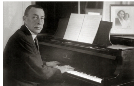
Рахманинов за роялем. 1936.

Руки Рахманинова – это первое, что видят зрители на небольшой выставке, которая проходит сейчас в Москве. Это отличная фотография. Она много говорит о характере композитора, который был закрытым и скромным человеком, совсем не любил публичности, и хотел, чтобы его не видели, а слышали.