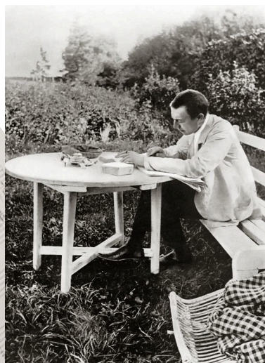
Сергей Рахманинов Фото. 1910 Public Domain

“Я русский композитор, моя родина определила мой темперамент и мировоззрение. Моя музыка – детище моего темперамента, поэтому она – русская”. Сергей Рахманинов