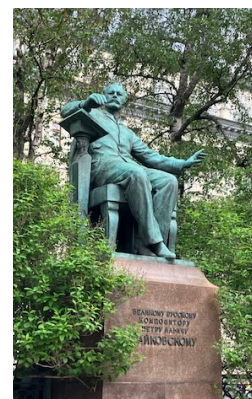
Памятник Чайковскому перед консерваторией

Закончил он блестяще консерваторию, получил, как мы сегодня скажем, два диплома, он получил золотую медаль. Чайковский принимал экзамен у Рахманинова, и он поставил ему самую высокую оценку в России, это пятёрка, и даже поставил три плюса. Он был в восторге от оперы, которую написал молодой Рахманинов, оперы "Алеко". А Рахманинову в то время было 19 лет, только 19 лет.